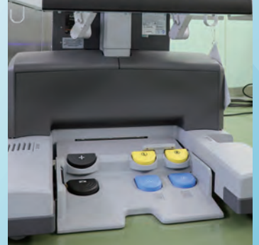
動作テスト（外科の医師が操作しています）