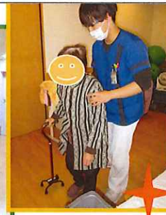
杖を使った歩行練習