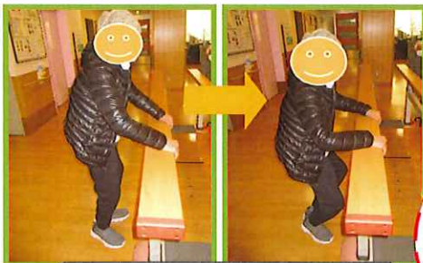
平行棒を使ったスクワット