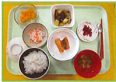
～魚の竜田揚げ、 サツマイモとあずきの煮物～