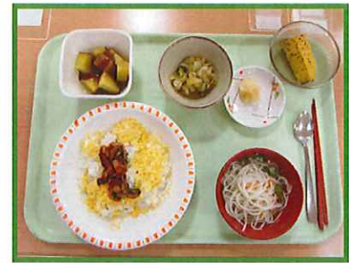
～ちらし寿司、七夕汁～