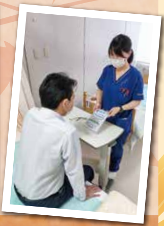
「わたしの治療日記」の記入方法