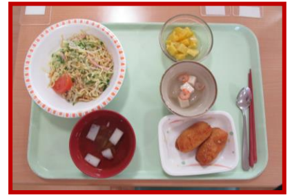
～冷やし中華、 いなりずし～