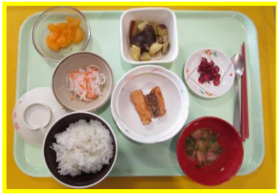
～魚の竜田揚げ、 サツマイモとあずきの煮物～