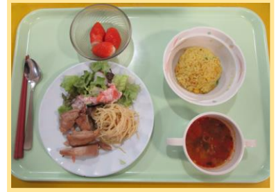
～和風ローストチキン ミネストローネ～