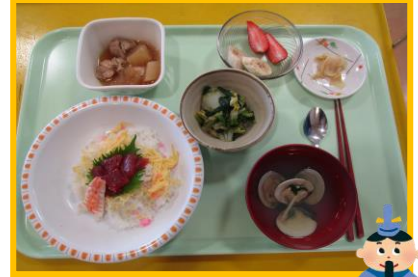
～ひなちらし、 潮汁（はまぐり）～