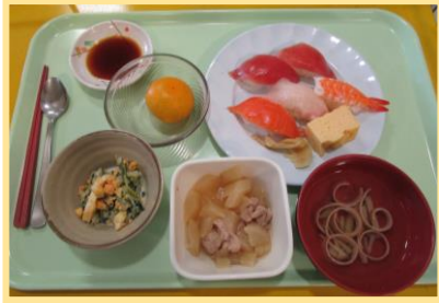
～にぎり寿司 大根と鶏肉の煮物～