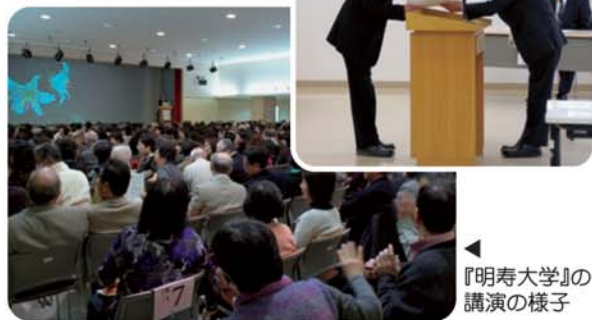
▶ 『明寿大学』の講演の様子

2月9日、前橋中央公民館（前橋プラザ元気21）にて前橋市教育委員会による「前橋市社会教育活動功労者 感謝状 贈呈式」が行われ、32の個人と団体が出席、当院も長年の社会教育への尽力に対し感謝状の贈呈を受けました。