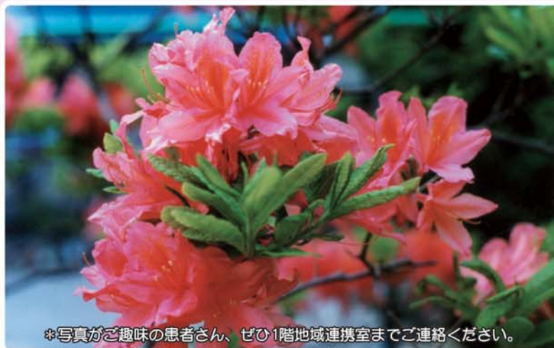
*写真がご趣味の患者さん、ぜひ1階地域連携室までご連絡ください。