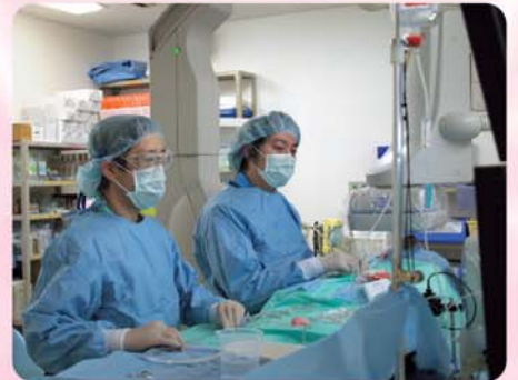
心臓カテーテル検査中…子どもの心臓カテーテル検査では、微妙な操作が要求されます。

当院として積極的に助言・受け入れを行うことが可能です。 その他、子どものあらゆる健康問題のよろず相談窓口として、当科をご利用いただければ幸いです。