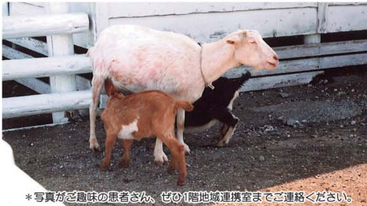
*写真がご趣味の患者さん、ぜひ1階地域連携室までご連絡ください。