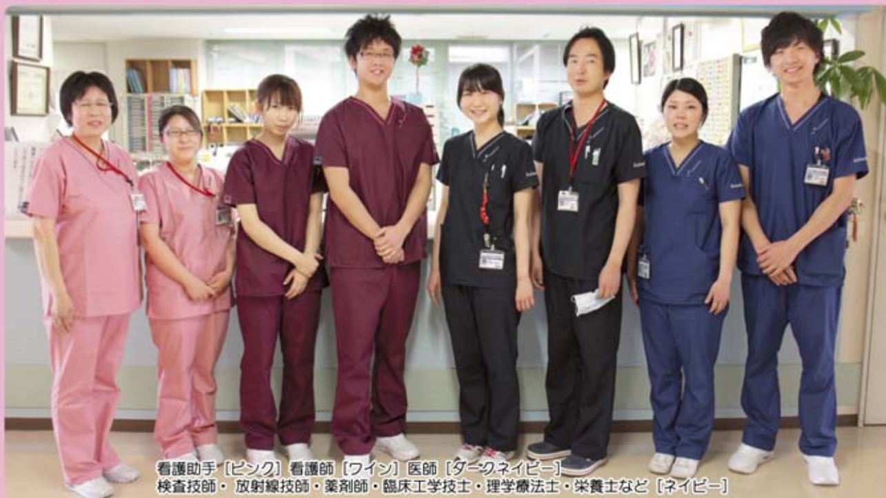
看護助手 [ピンク] 看護師 [ワイン] 医師 [ターコイズブルー] 検査技師・放射線技師・薬剤師・臨床工学技士・理学療法士・栄養士など [ネイビー]

色物のスクラブは白一色の医療着より活動的でリラックスした印象を与えることが出来ます。今回の購入を機会に患者さんの緊張感を少しでも和らげ、病院を明るくすることが出来ればと思っています。