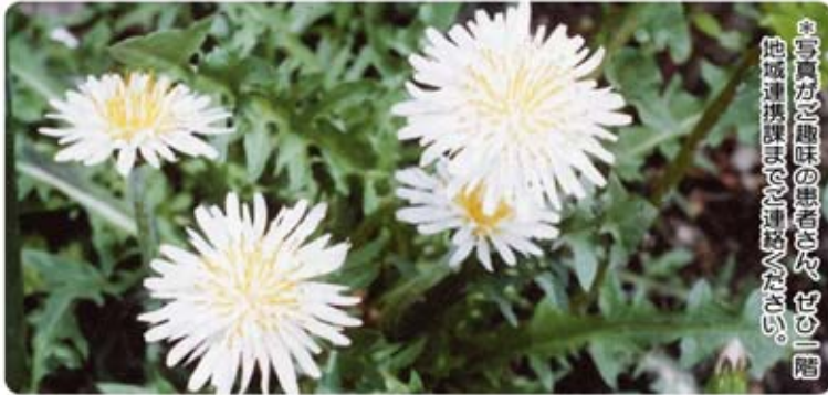
写真が、趣味の患者さんで、二階地域連携課までお運びなさい。

九州や中国地方で多く見られますが、温暖化の影響からか最近では関東地方でも見つけることができるようです。花言葉『私を探して、そして見つめて』は、タンポポの仲間の中でも珍しく白い花を咲かせることからつけられたのでしょう。黄色いタンポポは遠くからでも眺めてしまうのですが、白いタンポポを見つけたら、きっと花言葉とおり立ち止まって見つめてしまいますね。