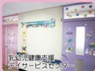
乳幼児健康支援 デイサービスセンター

当院C棟5階に前橋市が運営する、乳幼児健康支援デイサービスセンターがあります。こちらでは、「病後安静にさせたいお子さんを一時的にお預かりする