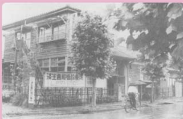
昭和18年3月 前橋市北曲輪町にて 済生会前橋診療所開設

今後とも地域に貢献できる病院として、より一層努力していく所存ですので宜しくご支援、ご鞭撻のほどお願いいたします。